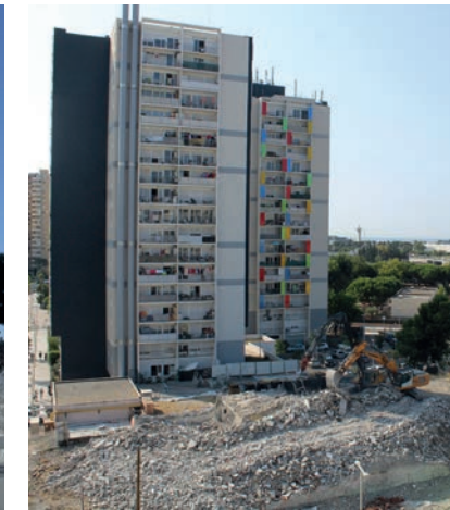
Évacuation des gravats sur l'espace libéré