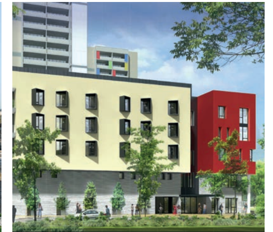
Futur foyer d'accueil médicalisé