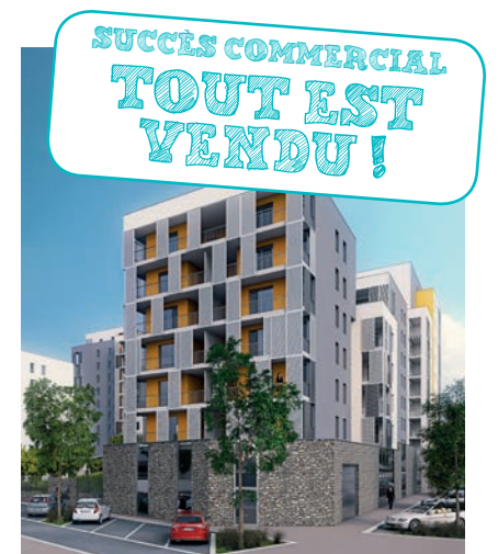
Future résidence Les 4 Vents