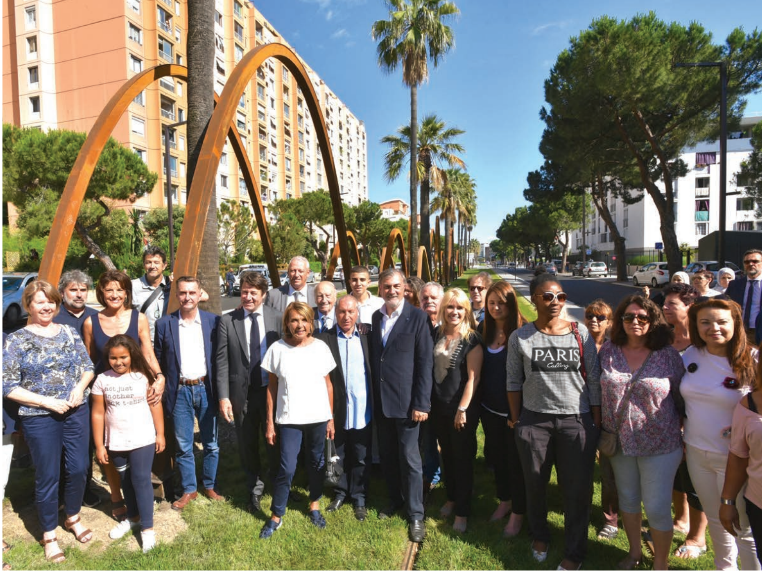
Le 14 juin dernier, les habitants ont pu découvrir l'œuvre monumentale « L'Éloge du déplacement », inaugurée en présence de l'artiste Philippe Ramette