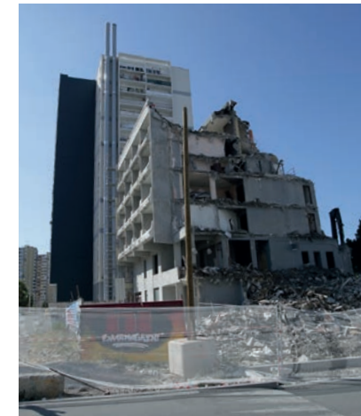
Démolition par grignotage

La démolition de la maison de retraite a été un moment impressionnant pour tous les habitants. La disparition de ce bâtiment marque le renouveau du quartier. Il laissera sa place à un foyer d'accueil médicalisé pour personnes handicapées dont la construction débutera cet automne.